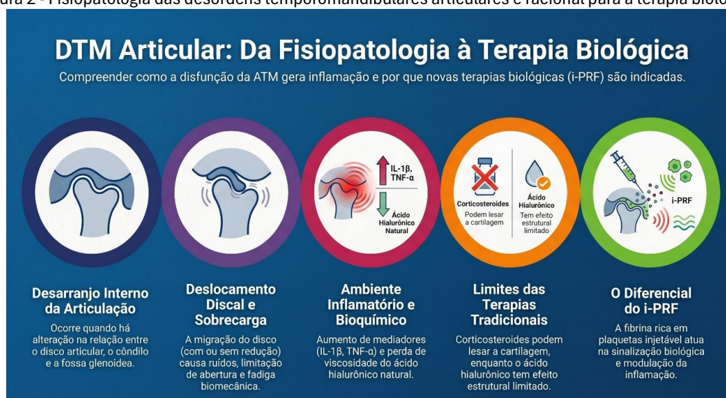
Figura 2 - Fisiopatologia das desordens temporomandibulares articulares e racional para a terapia biológica.

Nota: Esquema da articulação temporomandibular em condições fisiológicas e no deslocamento discal, ilustrando